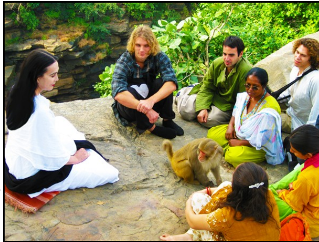
Un mono se une a nuestra clase en las cascadas.

en nuestra cocina; un discípulo preparó una cantidad de lentejas tan saladas, que en vez de ponerle sal al resto de mi comida, le estaba poniendo pizcas de lentejas. Y si demasiada sal no es la cuestión, ¡Nuestro antojo por lo dulce ha ido aumentando! Con frecuencia después de predicar, hacemos una parada en la mejor dulcería del mundo, “Ksheer Sagar,” y disfrutamos de algunas de las preparaciones más deliciosas hechas de leche y azúcar.