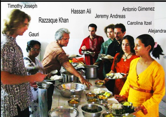
¡El Alimento para el Alma está servido!

¡Es bueno estar de vuelta en Benarés! Para muchos de nosotros el Centro Mundial de La Religión de Amor es el único lugar que verdaderamente podemos llamar hogar. Aquí es un tiempo para principalmente aprender, entrenar, purificar, y refrescar nuestras almas con la asociación de nuestra Maestra Espiritual y nuestras Hermanas y Hermanos de todas partes del mundo. Es tan beneficioso estar aquí y vivir bajo un